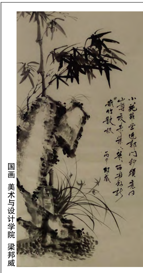
国画 美术与设计学院 梁邦威